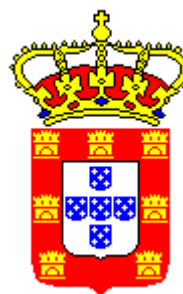
Figura 2: Brasão de D. João V.

O brasão das plantas de fortificação de Soares 48 é composto pelos seguintes elementos: uma espécie de suporte para sustentar o escudo de armas e a coroa com uma cruz, mais algumas flechas e canhões com a palmeira e/ou oliveira. O escudo é composto de sete castelos e as quinas (“as armas de Portugal nas suas bandeiras”) (BLUTEAU, 1789, p. 277), como na atual bandeira de Portugal, cujo suporte passa a ser uma esfera armilar. Os castelos representam a defesa e as quinas podem ser interpretados como tendo o intuito de aparar as arestas, ou os ângulos.