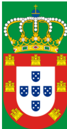
Figura 1: Brasão da Casa de Bragança.

mesma utilizada por Soares em seus desenhos para compor a legenda 47 ; esta, por sua vez, traz sublinhada a sua função de geógrafo de sua majestade, após detalhar a posição do terreno e a função da edificação.