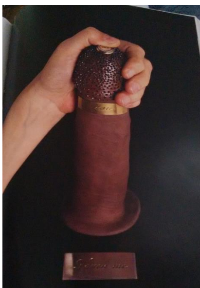
Figura 4 - Fotografia retirada do catálogo da artista

Touch me 150 representa o pênis do homem negro que precisa ser tocado para ter funcionalidade. A voz da boneca Barbie declara ao espectador: “I love you”, quando esse possui coragem para acionar um botão na glândula do objeto. Márcia traça um paralelo com o estereótipo do negro bem-dotado como um exemplar de virilidade. É importante salientar que nessa obra o espectador precisa tocar na genitália e apertar a glândula – que é considerada pela biologia como a parte sensível do órgão masculino. A glândula está cravejada de um material que não consigo determinar pelo catálogo, porém evoca uma sensação no espectador que se propõe a tal experiência. Além disso, possui uma faixa dourada com o dizer touch me . Observe o objeto pensado por Márcia: