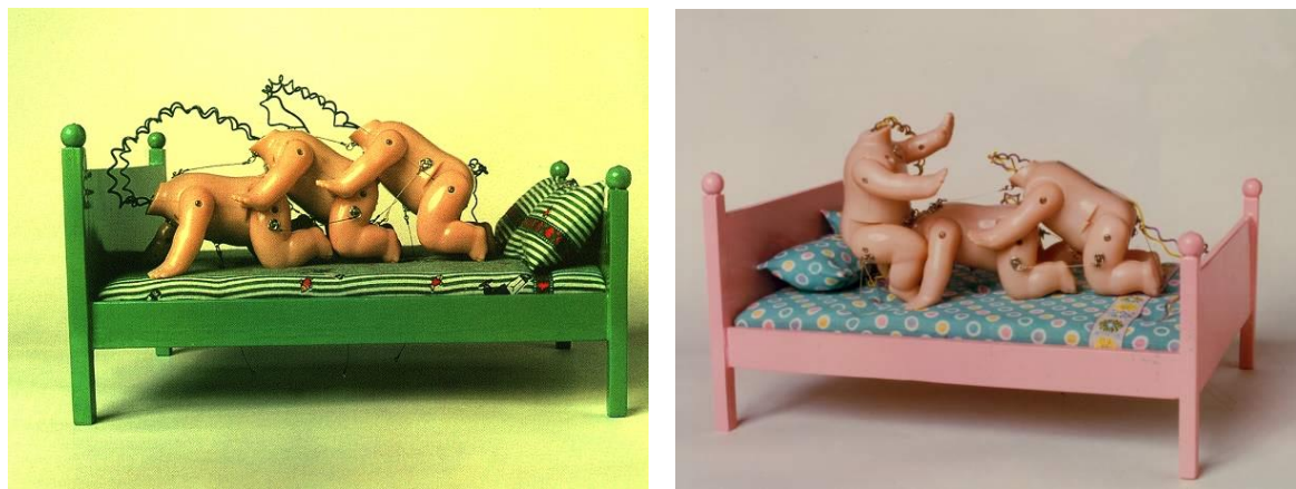
Figuras 2 - Imagens de os kaminhas Sutrinhas

Em segundo lugar: o trabalho de X. com o lúdico como dispositivo do sexo. Nas palavras de Márcia X. a representatividade e a descrição de Os Kaminhas Sutrinhas 134 :