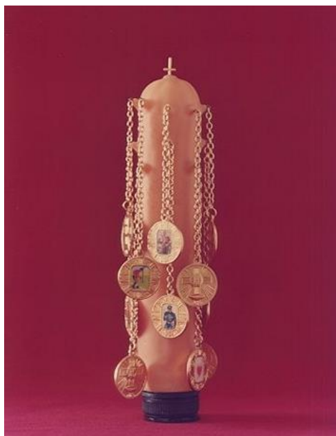
Figura 3 - Imagem da obra As Medalhinhas

A obra dessa série intitulada de Medalhinha apresenta um pênis de um homem branco, com aproximadamente 16 medalhinhas. O uso de alguns símbolos é provocativo, como a imagem de um jogador de futebol no espaço reservado para um santo, um super-herói, um coração, uma imagem de São José – considerado “Padroeiro das Famílias e Trabalhadores”, uma medalha com o símbolo da Eucaristia 149 .