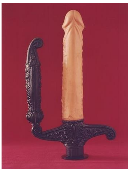
Figura 5 - Objeto da Série Fábrica Fallus

Uso um fragmento de Phillippe Sabot 155 para pensar na rede discursiva que gira para além do sexo heterossexual ou homossexual.