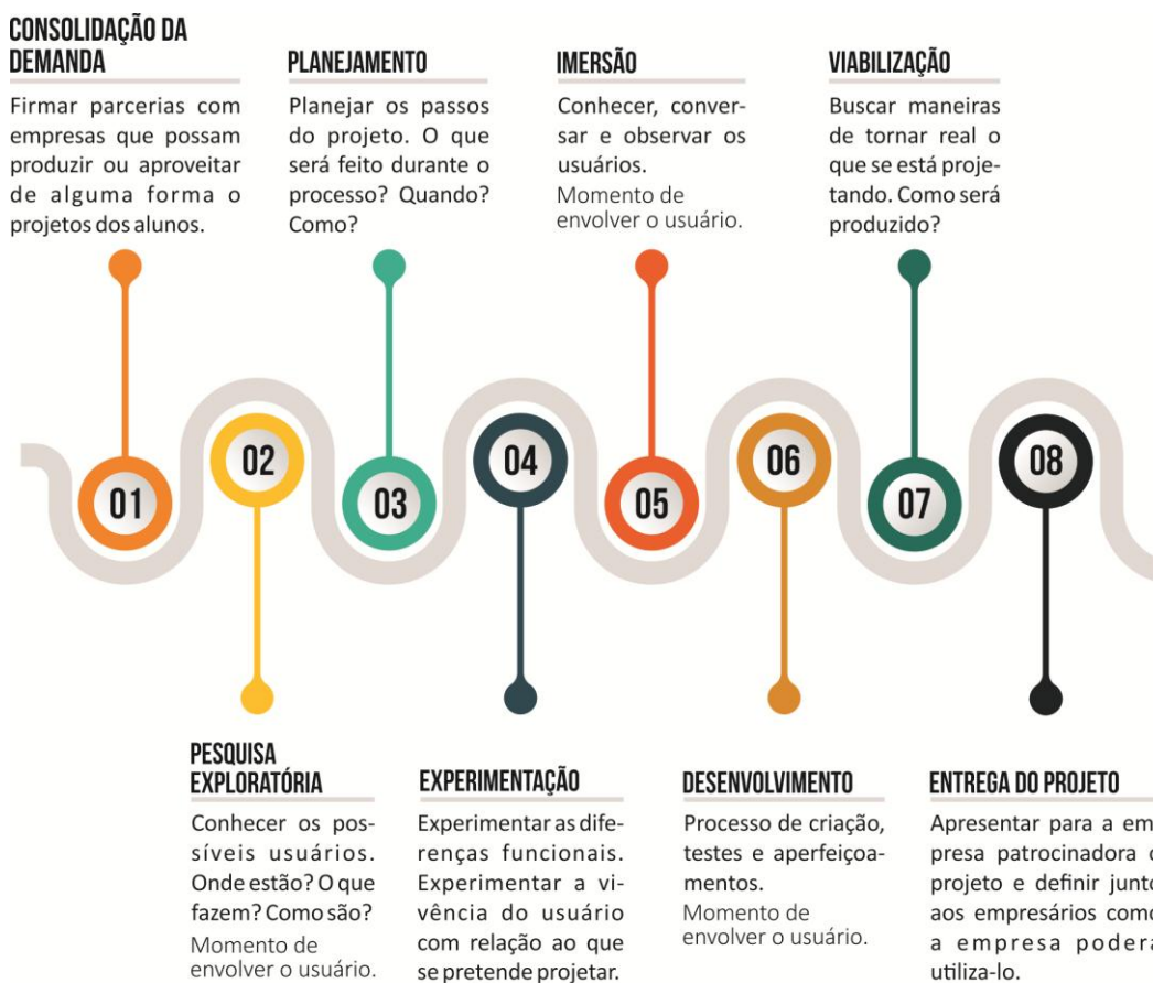
Figura 6.5: Atividades sugeridas pelos respondentes para o ensino do Design Inclusivo.

aluno é treinado para não se restringir aos seus “achismos” procurando sempre o engajamento do usuário no processo projetual. Pode-se traçar um caminho interessante para a prática docente do DI com todos os apontamentos dos professores respondentes, a seguir: