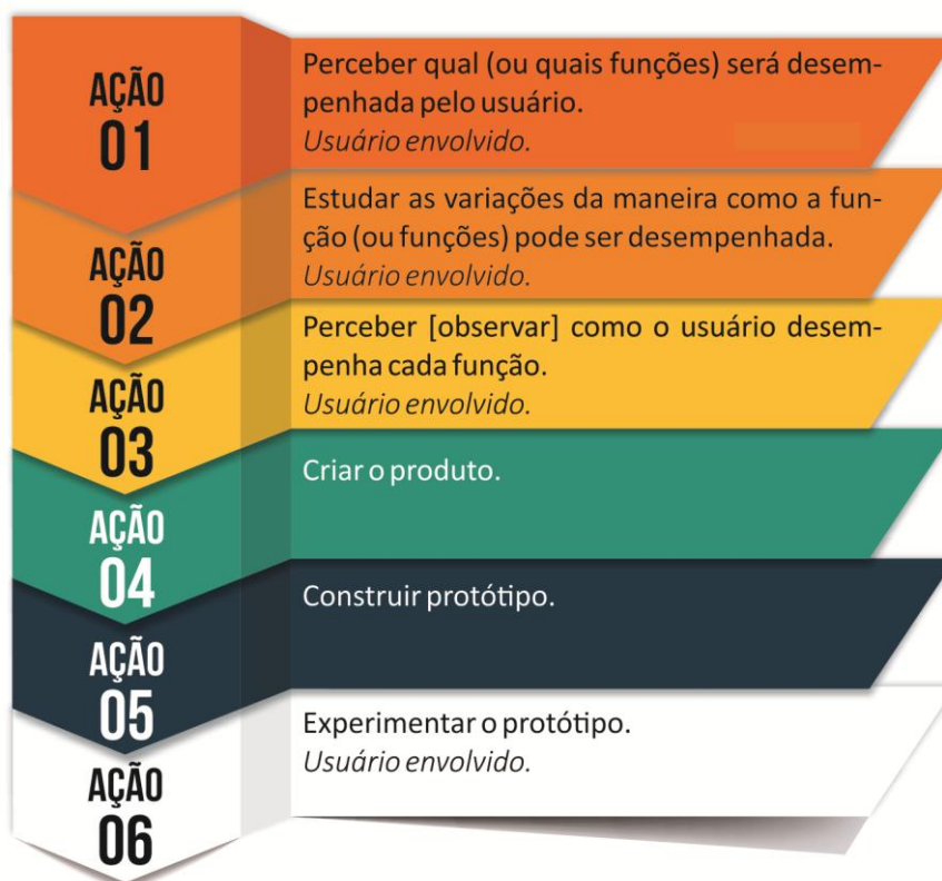
Figura 6.2: Série de ações a serem executadas em um projeto inclusivo segundo o Respondente oito (8).

R8 apresenta uma série de ações como um caminho para o projeto inclusivo: