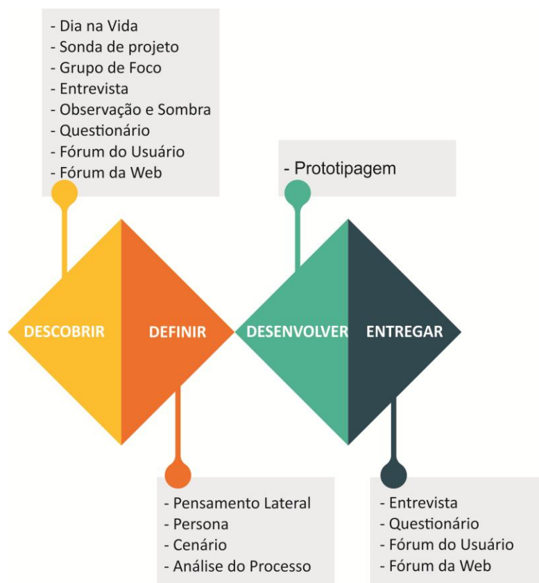
Figura 6.4: Métodos/técnicas sugeridos por Helen Hamlyn Centre for Design inseridos processo do Double Diamond .

Diante das práticas de projeto e sugestões do R1, podem-se encaixar no processo do Double Diamond métodos/técnicas sugeridos por Helen Hamlyn Centre for Design . Abaixo a figura 6.4, mostrando onde cada método pode se encaixar no processo do Double Diamond .