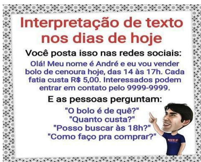
Figura 3: meme- interpretação de texto nos dias de hoje

As redes sociais também funcionam como uma espécie de espelho para que se possa comprovar como a situação de muitos brasileiros com relação à leitura e compreensão de textos se encontra atualmente. Não raro, vejo que muitos internautas comentam notícias com discursos sem quaisquer sentido ou coerência, demonstrando não terem compreendido o que leram. Vejo também muitas postagens no Facebook divulgando a venda de algum produto ou serviço, por exemplo. Mesmo contendo informações tais como: local, preço, telefone de contato, página virtual, etc., há quem ainda pergunte por elas novamente, tornando-se, inclusive, assunto para memes 2 , como esse a seguir: