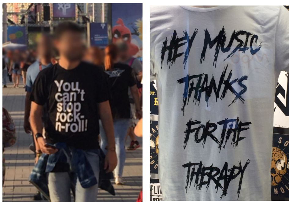
Figura 7: Mensagens nas camisas.

Registros da edição de setembro de 2017 do Rock in Rio, realizada na cidade do Rio de Janeiro.