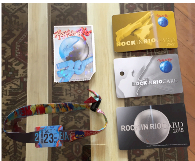
Figura 20: Ingressos do Rock in Rio guardados pelo filho da “família 2”