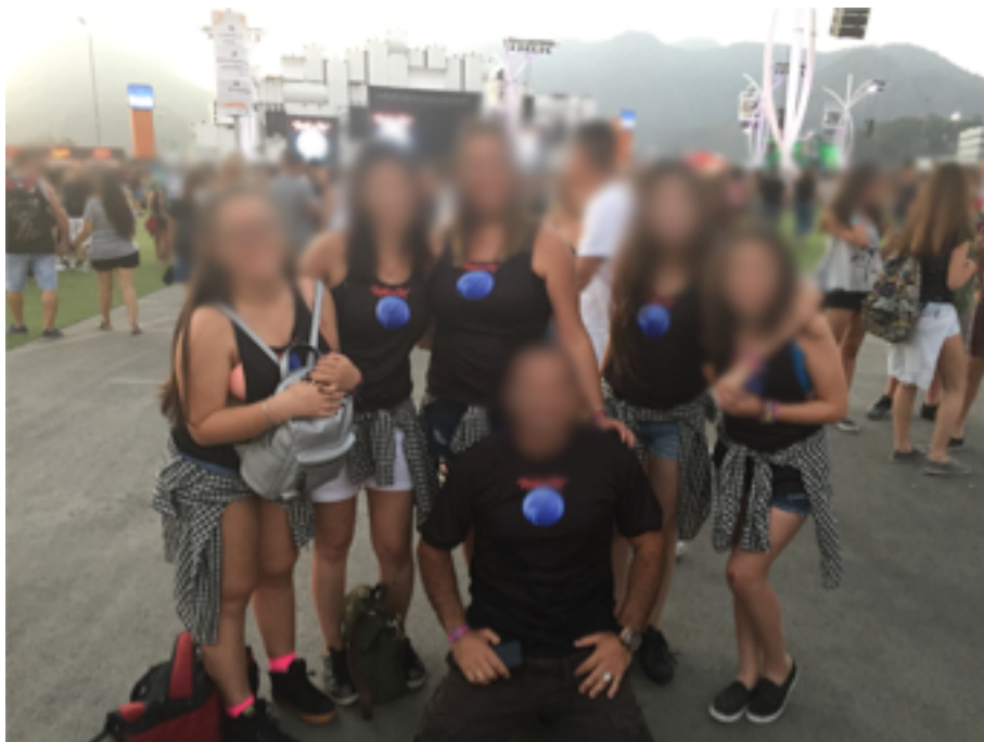
Figura 10: Família com vestuário propositadamente homogêneo.

(c) A família que não só mandou fazer a própria camisa, como se preocupou em adequar outros acessórios para formar um visual uniforme; e fizeram questão de se posicionar de frente e de costas para o registro aqui exposto (Figura 10).