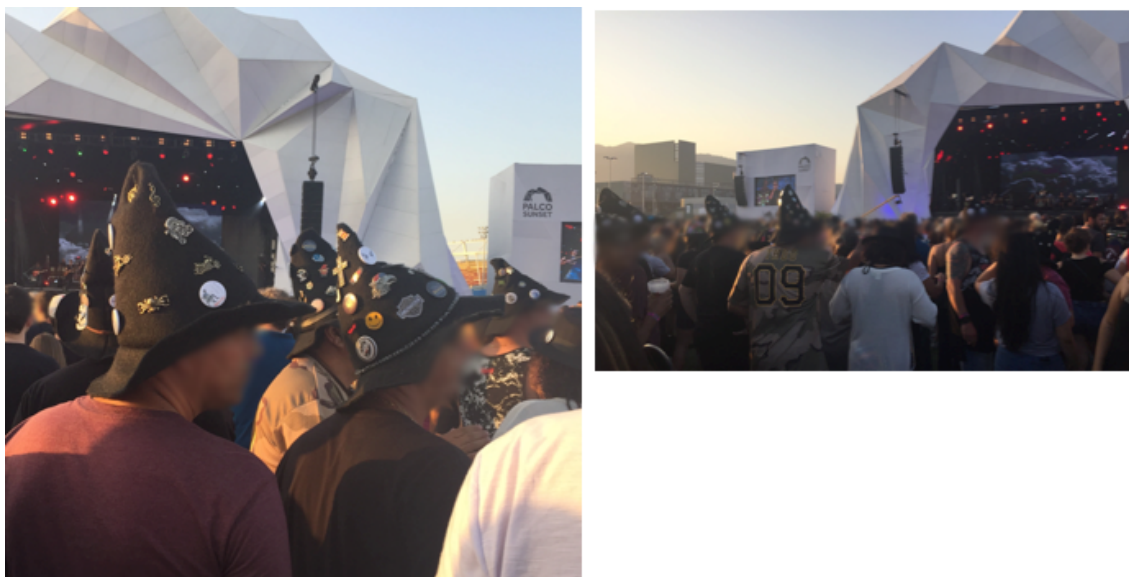
Figura 13: Chapéu que identificava o grupo em meio à audiência.

Fonte: Acervo pessoal da autora. Registros da edição de setembro de 2017 do Rock in Rio, realizada na cidade do Rio de Janeiro.