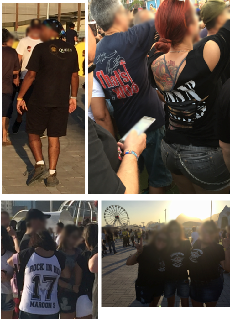
Registros da edição de setembro de 2017 do Rock in Rio, realizada na cidade do Rio de Janeiro.

Durante a pesquisa de campo, também foi amplamente observado, entre a audiência, o uso de camisetas, broches e outros acessórios que fazem alusão à participação em outros festivais de música espalhados pelo mundo ou, ainda, em grupos com “traços subculturais” (HAENFLER, 2014) - entre eles, por exemplo, os motoqueiros Harley-Davidson, além dos adeptos do heavy metal e do movimento punk (Figura 6).