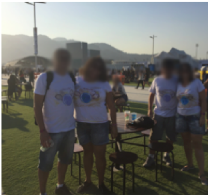
Figura 8: Camisetas com caricaturas do grupo junto à marca Rock in Rio.

que optaram por confeccionar, por conta própria, itens de vestuário pensados de forma a serem usados e produzirem significado exclusivamente em função de sua participação no Rock in Rio, além de combinações de itens já existentes e padronizados, porém usados, durante o festival, de forma a reunir o grupo em torno de um objeto e, assim, torná-lo visualmente distinto do restante do público. Citam-se aqui alguns destes exemplos, embasados por curtas interações verbais realizadas junto a tais grupos durante o trabalho de campo, além das imagens que os ilustram, no intuito de facilitar a visualização desta apropriação criativa do vestuário que se pretende demonstrar: (a) primeiramente, um grupo formado por dois casais, onde todos usavam camisetas iguais, cuja ilustração trazia as imagens de suas próprias caricaturas aliadas à marca oficial do Rock in Rio (Figura 8).