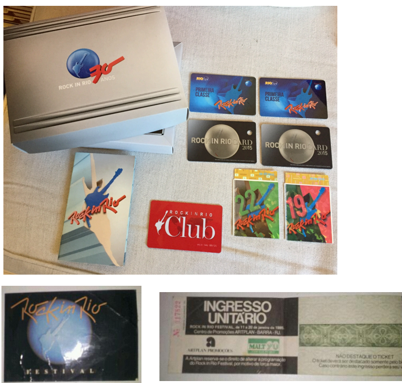
Figura 18: Ingressos do Rock in Rio guardados pelo pai da “família 3”.