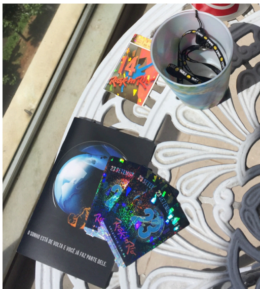
Figura 19: ingressos e copo guardados pela filha da “família 1”