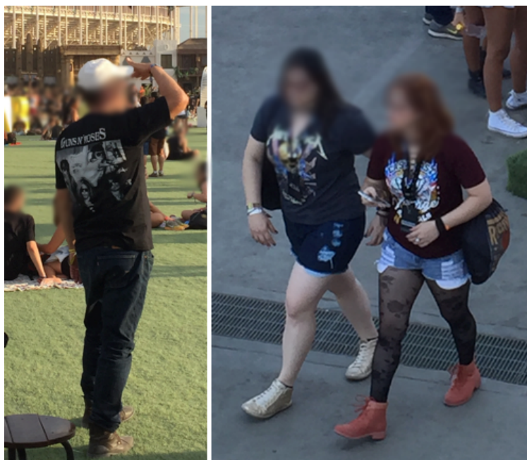
Figura 5: Camisas com nomes e imagens de bandas musicais.

Nas mais diversas situações da vida social, o vestuário se inclui no universo de bens capazes de comunicar algo sobre as pessoas, suas escolhas, preferências e sua hierarquia de valores (DOUGLAS; ISHERWOOD, 2013). Mas, durante a realização do Rock in Rio, observou-se que o modo de se vestir converte-se em uma prática comunicacional ainda mais acentuada: as pessoas parecem ter a intenção explícita de usar roupas e acessórios que expressam alguns de seus valores ou certos aspectos de seu estilo de vida. As camisetas com fotos e nomes de bandas – estando estas presentes ou não na programação do festival – são uma constante e dizem algo sobre preferências musicais (Figura 5).