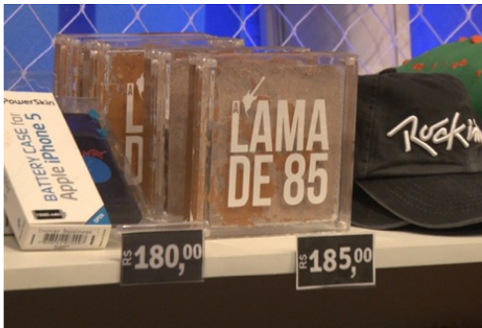
Figura 21: A “lama de 85” vendida na edição de 2015 do Rock in Rio