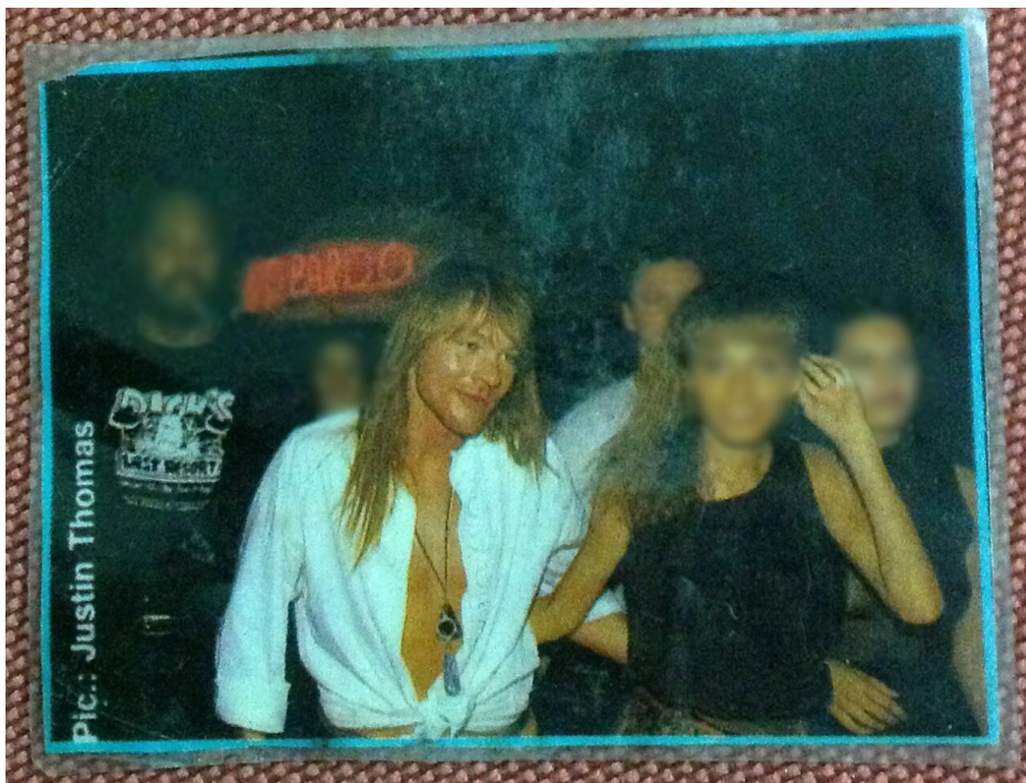
Figura 17: Irmã mais nova da entrevistada ao lado do cantor Axl Rose.

Fonte: Acervo pessoal da entrevistada nomeada como mãe da “família 3”. Registro da edição de 1991 do Rock in Rio, realizada na cidade do Rio de Janeiro.