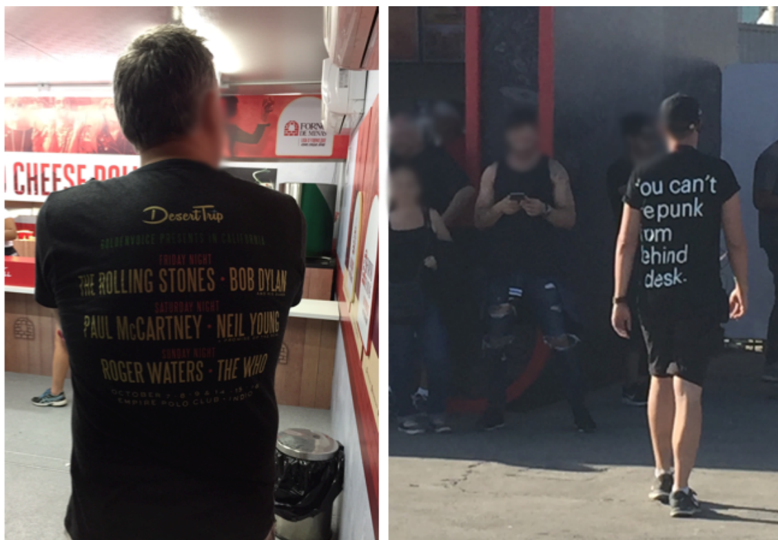
Figura 6: Camisas com menção a outros festivais ou a traços subculturais.

Registros da edição de setembro de 2017 do Rock in Rio, realizada na cidade do Rio de Janeiro.