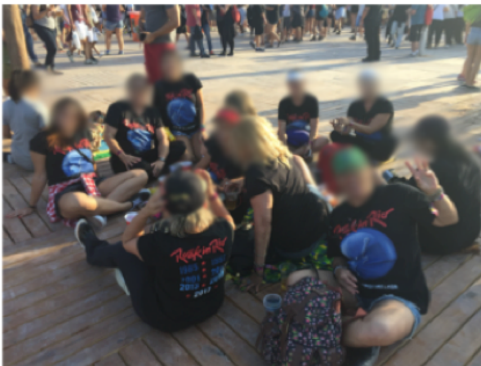
Figura 9: Grupo feminino com frequentadoras de todas as edições.

Registros da edição de setembro de 2017 do Rock in Rio, realizada na cidade do Rio de Janeiro.