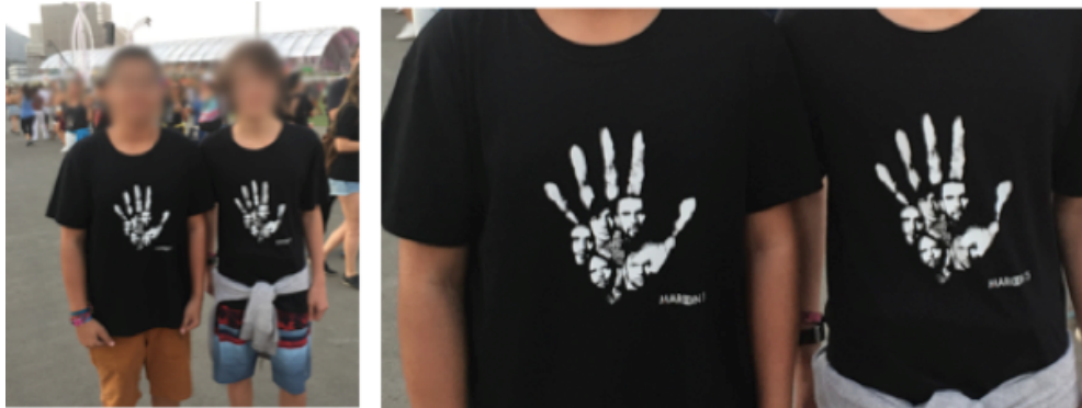
Figura 11: Amigos adolescentes com camisetas iguais de sua banda favorita.

Registros da edição de setembro de 2017 do Rock in Rio, realizada na cidade do Rio de Janeiro.