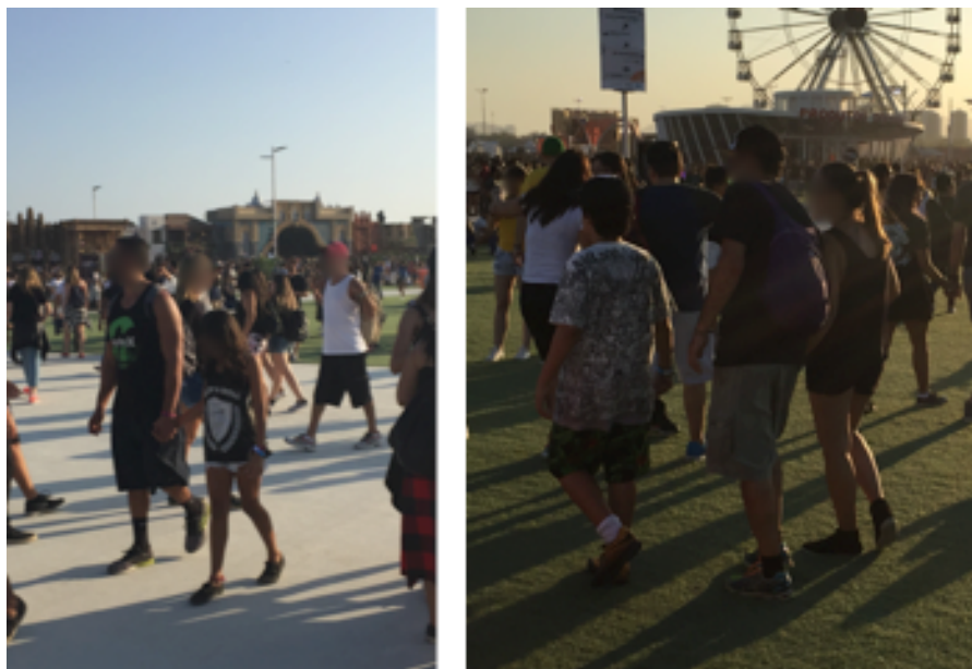
Registros da edição de setembro de 2017 do Rock in Rio, realizada na cidade do Rio de Janeiro.

Ao caminhar pela Cidade do Rock, também foi identificada, com certa facilidade, a presença de grupos compostos por indivíduos de distintas gerações, e de variadas dimensões, muitas vezes formados por indivíduos com algum vínculo de parentesco – o que foi confirmado em breves conversas, com estes, ocorridas durante o trabalho de campo. Além disso, notava-se também, na composição maciça da audiência, a presença de pessoas de idades variadas, porém agrupadas exclusivamente junto a outras de faixa etária aparentemente similar. Vale mencionar, no entanto, que em diversos momentos e de muitas maneiras, esses indivíduos ou grupos, independentemente da idade, apresentavam comportamentos muito similares aos de outros indivíduos ou grupos de faixa etária bastante distinta. E, ao mesmo tempo, havia ocasiões em que notava-se claramente a existência de símbolos e preferências conectados a uma determinada geração. A seguir serão descritos exemplos que se referem a essas situações.