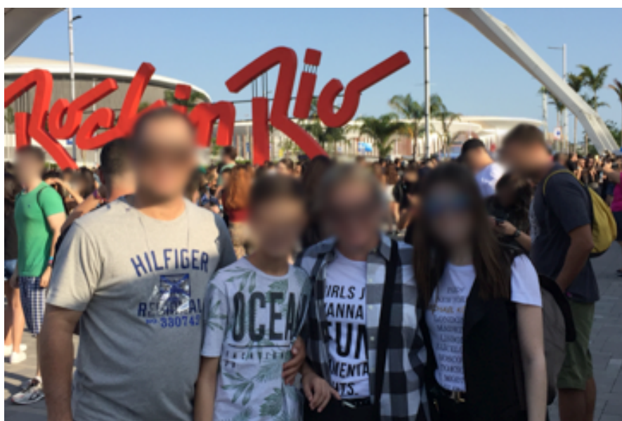
Figura 3: Famílias com adolescentes e crianças no Rock in Rio.

A pesquisa de campo confirmou as premissas, já indicadas pelas pistas iniciais citadas na introdução deste estudo, de um público composto por indivíduos de diferentes faixas etárias e da caracterização do Rock in Rio enquanto um ambiente propício à configuração de uma série de trocas geracionais no que diz respeito à interação social e à práticas comunicacionais. A suposição de que a pluralidade de gerações poderia estar ligada a um estilo musical, artista ou banda em particular não se concretizou: pode-se afirmar que esse foi um dos aspectos unanimemente observados nos quatro dias de realização do festival compreendidos na pesquisa, destacando-se, em um primeiro momento, a presença visível de muitos pais e/ou mães com seus filhos adolescentes e, até mesmo, algumas crianças (Figura 3).