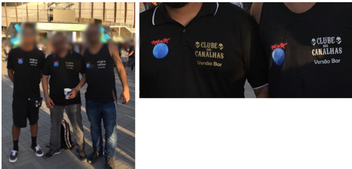
Figura 12: Grupo autodenominado “Clube dos Canalhas”.

Registros da edição de setembro de 2017 do Rock in Rio, realizada na cidade do Rio de Janeiro.