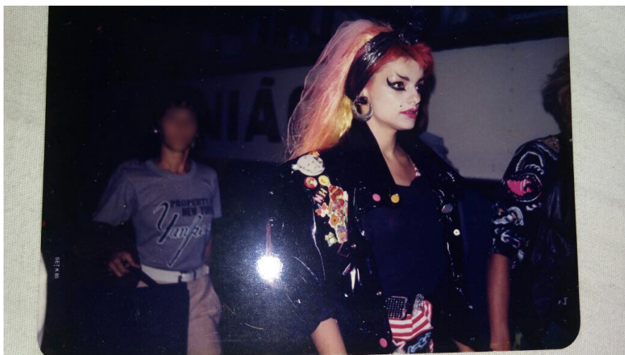
Figura 15: Irmã mais velha da entrevistada próxima à cantora Nina Hagen.

Fonte: Acervo pessoal da irmã mais velha da entrevistada nomeada como mãe da “família 3”. Registro da edição de 1985 do Rock in Rio, realizada na cidade do Rio de Janeiro.