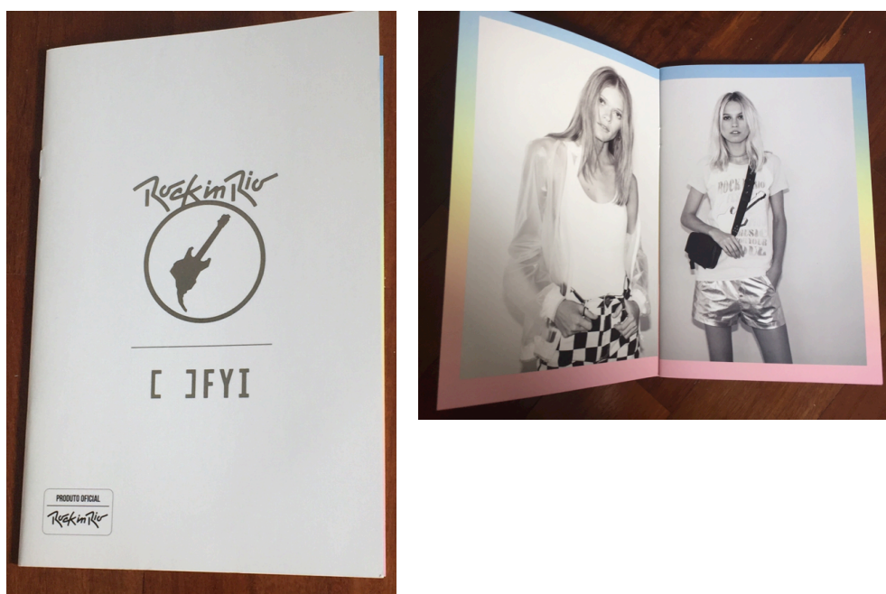
Figura 22: Catálogo com peças de vestuário com a marca Rock in Rio.

Fonte: Acervo pessoal da autora. Catálogo recebido durante visita à loja da marca “FYI”, no Shopping Leblon, na cidade do Rio de Janeiro.