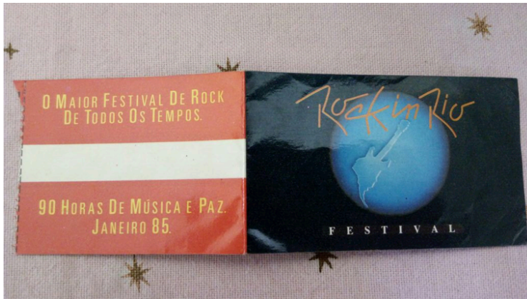
Figura 16: Ingresso do Rock in Rio de 1985