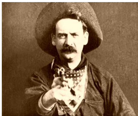
Fig.22. O Grande Roubo de Trem (1903, Edwin Porter).

promovendo uma integração permanente entre a tela e a platéia, através do enquadramento frontal e da interpelação direta que os personagens dirigem ao público, por meio de acenos, piscadelas e sorrisos 88 .