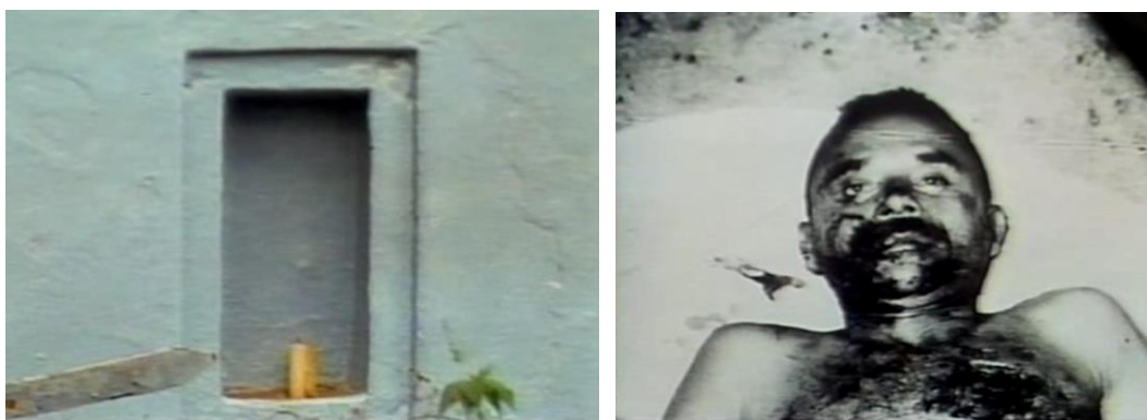
Fig.28. A ausência de vestígios de João Pedro Teixeira.

De modo similar ao método postulado pelo historiador italiano, Coutinho passa ao largo de uma pretensão em capturar aqueles eventos em sua totalidade ou estabelecer uma generalização reproduzível. Rastreamento, como um detetive ou um médico, todo tipo de sinais, vestígios e sintomas que envolveram as filmagens do antigo Cabra , Coutinho procura a singularidade daquelas experiências a fim de “captar uma realidade mais profunda”. Sobre este aspecto é particularmente expressivo o momento do Cabra no qual a história de João Pedro Teixeira é contada, justamente, na ausência quase total de vestígios. Percorrendo imagens da estrada onde ele foi assassinado, na qual foi construído um monumento em sua homenagem prontamente dinamitado nos primeiros dias de abril de 1964, e o cemitério onde seu corpo foi enterrado, a narração nos informa que em seu túmulo não há nenhuma inscrição e que, tampouco, sobrou alguma fotografia de João Pedro vivo. Essa sequência se encerra com a fotografia de João Pedro morto.