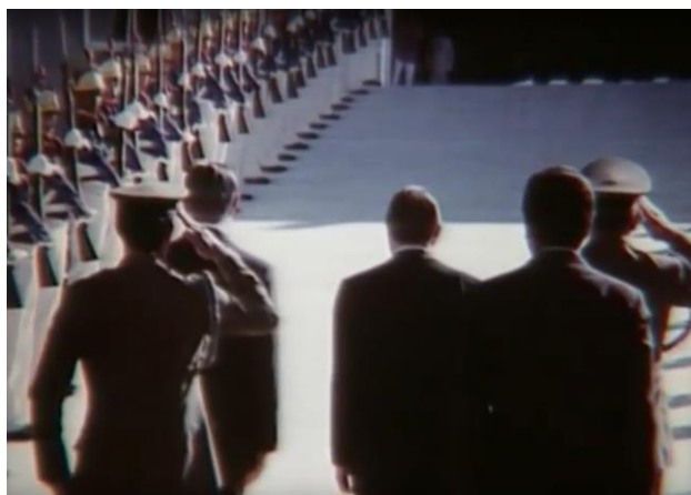
Fig.20. A posse de Sarney filmada por trás.

expressão da “República suspensa”. A história surge, portanto, como incerteza. E a posse de José Sarney, ao ser filmada por trás, na qual ele próprio se viu “pesado” 77 , em contraste com o “bom velhinho Tancredo”, apresentava-se como o próprio gesto de dar às costas ao povo, à República.