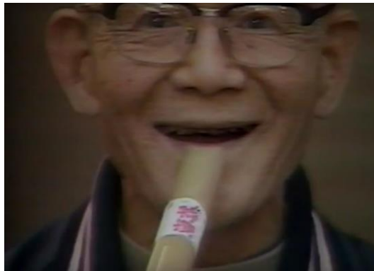
Fig.38. Imagem congelada de um japonês tocando sua flauta.

Junto às imagens, somos guiados pela onisciente narração de José Wilker a percorrer os mais variados aspectos da cultura nipônica. É preciso ressaltar que alguns recursos formais trazidos pelo vídeo são articulados de modo residual, sobretudo algumas imagens congeladas, que convidam a nos determos em algum aspecto observado em meio ao fluxo incessante de imagens.