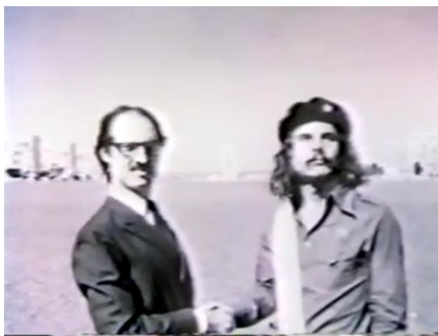
Fig.32. Encenação da condecoração de Jânio Quadros a Ernesto “Che” Guevara.

[...] um democrata que acredita na livre empresa, mas transige com os socialistas no atendimento de várias das exigências da vida moderna [...] a crescente intervenção do Estado no econômico, mesmo nas democracias mais ortodoxas, comprova, porém, o que afirmei, isto é, não pode a moderna democracia deixar de oferecer aspectos totalizantes [...].