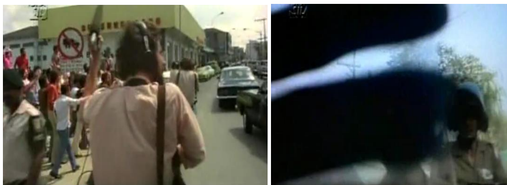
Fig.8. Equipe de filmagem em cena.

Essa situação paradoxal descrita por Nichols pode ser melhor apreendida no filme de Renato Tapajós em outro confronto entre operários e forças policiais durante a greve de 1980. Em determinado momento, um dos policiais diz à equipe de filmagem: “Vamos descendo, vamos descendo...”, com a intenção de evacuar a área. Ouvimos, então, a voz de uma mulher membro da equipe dizer que estavam apenas fazendo a cobertura. A ação policial se torna mais ostensiva, chegando ao ponto de bloquear a filmagem com as mãos. Novamente, a mulher tenta negociar argumentando que faziam parte do sindicato. Um dos policiais parte de forma abrupta em direção a ela que, em tom apreensivo, diz: “Ei, nós estamos andando...”. A sensação gerada nessa sequência, em meio ao tom de registro direto do filme, é de uma plena transparência do ocorrido.