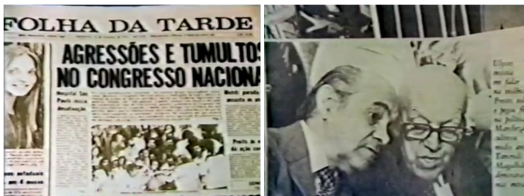
Fig.34. Os arquivos dessacralizados em Jânio a 24 Quadros .

O Brasil como uma grande chanchada, incluindo obviamente todo o conteúdo pornográfico que ela carrega. Não por acaso, após vermos mais uma entrevista peculiar de Jânio Quadros, na qual ele dizia que tudo que desejava era “[...] o estabelecimento, em nosso país, de um regime democrático autêntico. E... Para mim, um regime democrático autêntico é um regime democrático autoritário, forte. Porque... as coisas não são contradição em termos [...]”; a seguir, somos convidados, ao som de Mania de você (Rita Lee), a assistir a sucessivas capas de jornais evidenciando casos de conflitos no Congresso Nacional, a repressão da ditadura, querelas entre partidos políticos, as negociatas nos bastidores pela transição, onde os personagens mais sóbrios (ex: Tancredo Neves) e também os mais vulgares (ex: Paulo Maluf) compunham o mesmo jogo político.