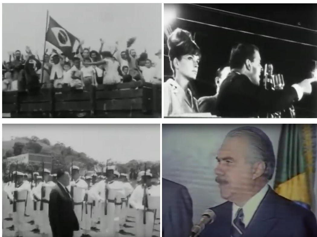
Fig.3. A batalha pela memória: o filme Jango e a posse de Sarney.

usos das imagens de arquivo (do contexto da ditadura) no cinema, na televisão, na imprensa 40 .