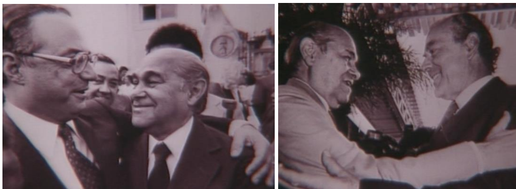
Fig.15. Sequência de fotografias evidenciando Tancredo Neves como um inerente conciliador.