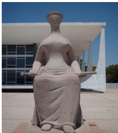
Fig.2. Estátua A Justiça .

Prosseguindo essa sequência, Sarney assinava o decreto da reforma agrária e, novamente, a imagem da estátua A Justiça era inserida em meio ao seu discurso, que se encerrava com a frase: “As origens do problema não são contemporâneos”. Esta sentença surge como um convite a dialogar com o passado. Porém, ao contrário da perspectiva conservadora de Sarney que verificaremos mais adiante, o filme de Tetê Moraes o faz através do ponto de vista dos vencidos.