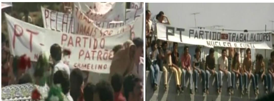
Fig.13. O nascimento do PT.

[...] o saldo mais importante que nós tivemos, na minha opinião, foi a descoberta da necessidade da organização política da classe trabalhadora. Porque, em todos esses anos de luta ficou provado de que tudo nesse país é decidido de acordo com as decisões políticas. Se tudo depende de uma decisão política, como é que a classe trabalhadora pode ficar sem tomar decisões políticas? Foi daí que a gente descobriu que era necessário [...] se organizar em um partido político. Então, acho que o saldo de tudo isso a gente, quem sabe, não colha ele hoje, e nem amanhã, mas eu acredito que a gente colherá ele, quem sabe, dentro de alguns anos [...]. Sindicalismo a gente faz pra tentar melhorar o relacionamento entre capital e trabalho. E política a gente faz pra transformar a sociedade.