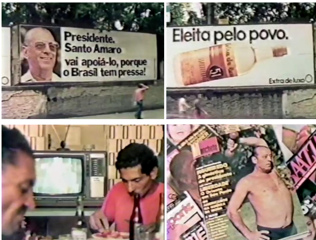
Fig.33. A sequência sobre a eleição de Figueiredo.

Com essa sequência podemos refletir, por exemplo, sobre a imagem da ditadura, regime marcadamente autoritário, naturalizada em meio a bens de consumo comercializados pela propaganda de massa. Onde se distingue, no fetichismo do mercado, o sisudo general Figueiredo da popular cachaça 51? São ambos eleitos pelo povo? Como a publicidade atuou de forma a legitimar a ditadura? E o trabalhador comum, sufocado durante anos de arrocho e repressão, que representatividade a eleição indireta daquele general lhe trazia? É a farsa do espetáculo da política que atravessa o filme, onde “chacretes” e “figueiredos” conformam a mesma obscenidade encarnada na “família brasileira”. Mais uma vez, recorro à preciosa leitura de Andréa França sobre o filme: