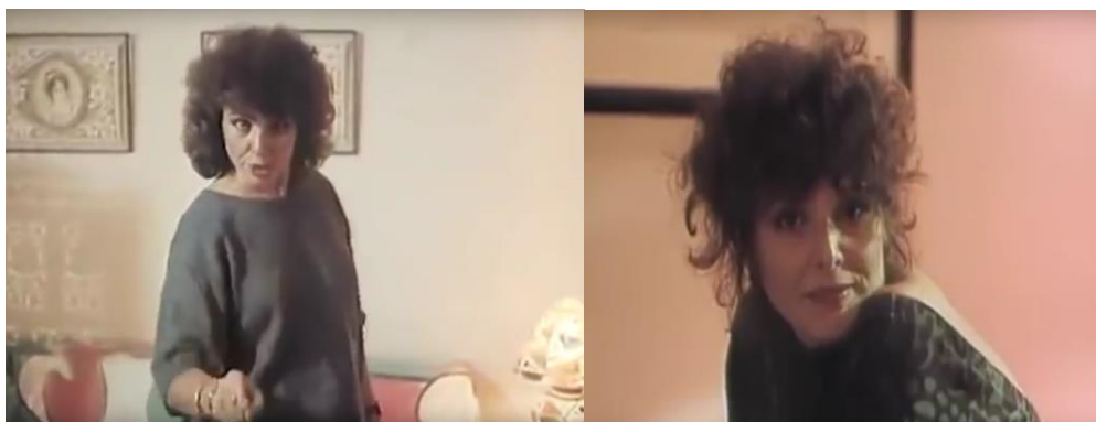
Fig.21. Irene Ravache se dirige ao espectador em Que bom te ver viva .

Até então, essa sequência respeitava os códigos de uma representação naturalista como se Ravache dialogasse consigo mesma. É apenas quando trata do torturador que a atriz se vira para a câmera e profere de forma incisiva: “Todos vocês acham que a gente é diferente, só pra fingir que nunca vão estar no lugar da gente”. Este momento é seguido de uma explanação exaltada na qual Ravache brada por “uma forca pra cada um de nós em praça pública”. A atriz, então, dá um gole numa bebida, vira-se para a câmera novamente e diz “Pode parar, pode parar. Guardem a minha pra quando eu tiver 80 anos. Essa é a minha história e vocês vão ter que me suportar”.