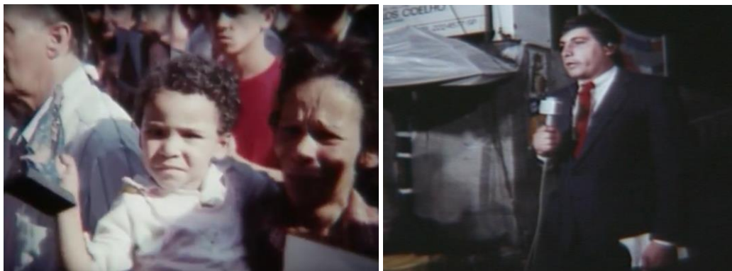
Fig.16. O povo desesperado, a mídia desorientada.

corpos. Em seguida, opta pelos jornalistas e a montagem tumultuada, num dos momentos de quebra sutil do efeito de transparência, procura assinalar a desorientação que tomava conta daquele ambiente.