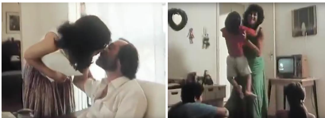
Fig.24. A superação das personagens de Que bom te ver viva .