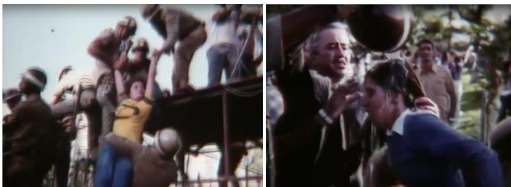
Fig.19. O desespero para adentrar o Palácio da Liberdade (MG).

Essa situação é hiperbolizada já perto do final do filme, quando o corpo de Tancredo Neves chega em Minas Gerais. Em volta do Palácio da Liberdade, vemos uma multidão apinhada tentando, de qualquer maneira, romper a barreira que os impedia de entrar no Palácio onde era velado o corpo de Tancredo. Num cenário de completa histeria coletiva, pessoas desmaiam, ferem-se nas grades pontiagudas, corpos são conduzidos sobre as cabeças amontoadas.