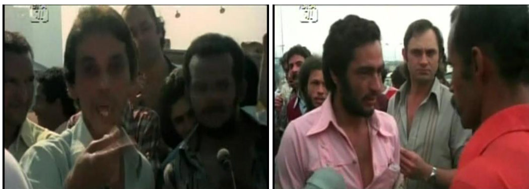
Fig.11. Fissuras na representação: operários colocam suas vozes

convocar operários para uma assembleia. No decorrer dessa cena, Djalma assume o papel de entrevistador no filme e interpela um trabalhador se ele iria parar. De pronto, o rapaz lhe responde: “Eu sou o primeiro a parar”. Djalma, então, lhe devolve outra pergunta: “Você é o primeiro. E se acontecer alguma coisa com o Lula, o que o trabalhador deve fazer?”. O rapaz responde: “Os trabalhador, nós tem que ser unidos. Tem muito furão, mas nós dá um jeito neles”. Assim, a narrativa seguia coesa até que o rapaz, então, profere: “Dessa vez, se nós parar, vai ser parado mesmo, hein! Ninguém vai voltar, não tem mais 45 dias, não. Nem 15 dias, nem nada”. Djalma, que ali ocupava o papel de representante da diretoria, dá um sorriso meio sem-graça após a fala do operário e termina conclamando: “Trabalhador unido, jamais será vencido!”. A fala daquele trabalhador se dirigia à trégua proposta por Lula que, no documentário, foi apresentada sem dissensos. Esse breve momento, portanto, revelava uma fissura na representação homogênea de adesão às convocações da diretoria sindical. É uma das raras vezes na qual um trabalhador fala por si.