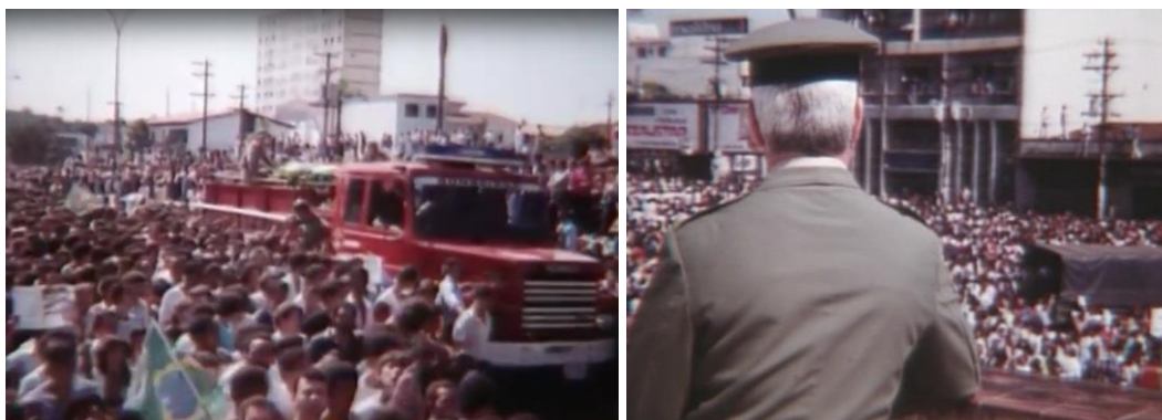
Fig.14. A sequência de abertura de Céu Aberto .

um militar, de costas e à certa distância, observando a multidão, imagem que acena para a superação do regime militar que João Batista procurou retratar 65 .