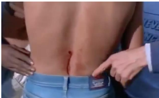
Fig.6. Sem-terra denunciam a repressão.

Porém, sob a égide da objetividade e do didatismo documental, o recurso da narração e a montagem em Terra para Rose acabam por asfixiar as falas das depoentes. Rose e as demais camponesas cumprem a função de atestação do argumento esboçado no começo e concluído no fim do filme, notadamente, a permanência das desigualdades sociais no campo e a necessidade da luta empreendida pelo Movimento Sem-Terra.