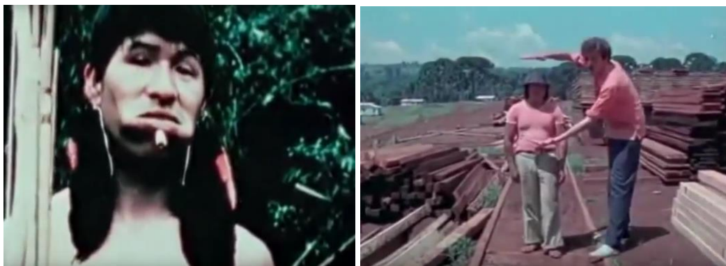
Fig.36. O último Xetá.

A música romântica da ópera de Carlos Gomes O Guarani soa celebratória na trilha sonora, criando expectativas de um espetáculo épico-heróico. As imagens que se seguem, contudo, rompem radicalmente com as pretensões épicas tanto do título quanto da abertura musical. O que vemos é apenas o único sobrevivente da tribo, literalmente o “último dos Xetás”, apresentado numa série de fotografias (frontal, perfil esquerdo, perfil direito) que carrega reminiscências das fichas policiais. O bravo guerreiro do romantismo é agora o desprezado e manipulável objeto do discurso oficial das fotos de polícia que friamente registram o homicídio 136 .