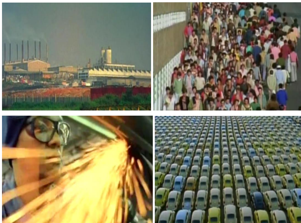
Fig.7. A sequência de abertura: O trabalhador e a realização de seu trabalho.

fábrica, termina com a realização do trabalho alienado daqueles operários, revelando uma imensa fileira de automóveis prontos para serem comercializados.