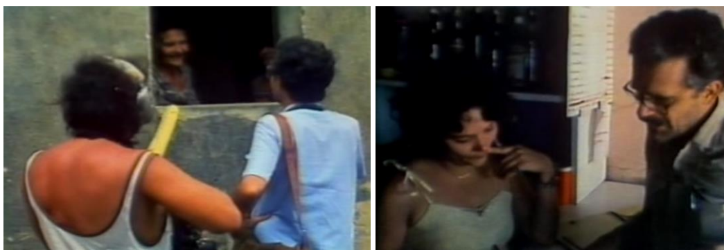
Fig.26. Eduardo Coutinho e a equipe de filmagem em cena.

Os muitos momentos nos quais o diretor se coloca em cena ou dialoga com o espectador através de suas reflexões são expressivos da mudança de postura mencionada por Ismail Xavier. Coutinho surge, em meio aos demais, como mais um personagem daquela epopeia utópica que, de forma complicada, abrangeu estudantes universitários, operários e camponeses.