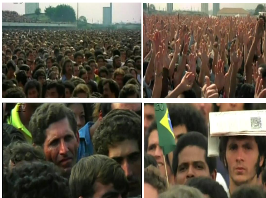
Fig.10. A classe trabalhadora por Tapajós: “milhares de operários, um só homem”

forma ativa no filme. Em geral, eles são representados enquanto uma coletividade expressiva, mas dependente de lideranças e seguindo suas diretrizes. Mais uma vez, é valioso perceber como Renato Tapajós vislumbrava a classe operária naquele período: “[...] em 1979/80, as nossas câmaras estavam retratando uma verdade, milhares de operários levantando os braços como se fossem um só homem, gritando uma palavra de ordem” 60 . Decorrem dessa visão, portanto, inúmeros momentos nos quais os trabalhadores são representados enquanto uma enorme massa amorfa que só fala ou levanta os braços quando convocada por seus líderes. Noutros, vemos alguns planos-fechados que expressam a sensação de incerteza e espera quanto ao retorno da diretoria sindical e o desfecho daquela luta.