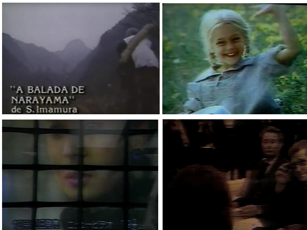
Fig. 40. Trânsito entre-imagens na série Japão: uma viagem no tempo .

Por essa perspectiva, o vídeo ocupa um lócus atemporal onde as mais variadas imagens se cristalizam. Não por acaso, junto aos “filmes de arte” mencionados, no documentário de Walter Salles agregam-se imagens publicitárias, programas televisivos, videogames , computadores, animações, fotografias, gerando uma só imagem: “À noção de plano, espaço unitário e homogêneo, o vídeo prefere a de imagem, espaço multiplicável e heterogêneo” 156 .