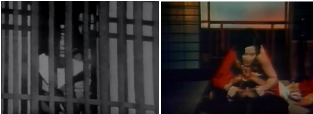
Fig.40. O fluxo de imagens heterogêneas na sequência sobre a sociedade patriarcal.

Entre a moda, a música e outros tantos aspectos culturais, a arquitetura parece sintetizar bem a profusão de imagens na sociedade japonesa. No episódio três, o narrador anuncia a obsolescência que marca o capitalismo contemporâneo: “[...] numa sociedade rápida, como a do Japão, o que é novo hoje, amanhã pode ser considerado velho”. Logo, são exibidas imagens do Centro Cívico Tsukuba, um conjunto de prédios onde se misturam todos os estilos arquitetônicos possíveis, conformando uma estética pós-moderna . O arquiteto daquela obra, Arata Isozaki, a explica: