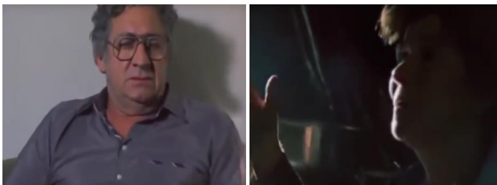
Fig.4. O conflito na montagem.

A Bíblia diz que a terra Deus deu para todos. A terra Deus não deu só pra uns tubarão, pra aqueles que podem. Pra criar inseto, pra criar fera, pra criar capim?! A terra é a coisa mais abençoada, é daonde nós tiramos o pão, pra sustentar os da cidade com o suor do nosso rosto.