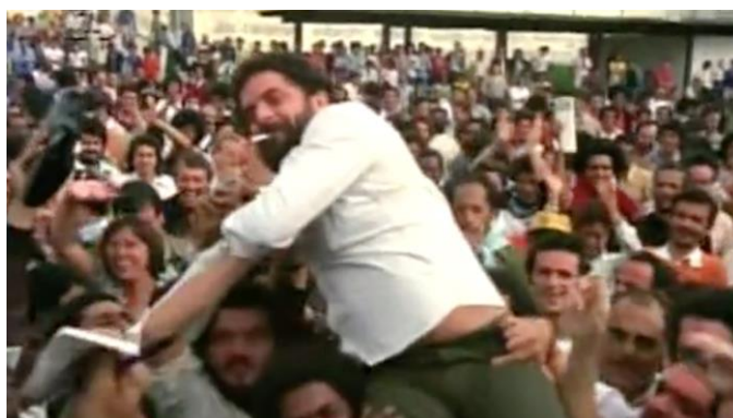
Fig.12. Um dos tantos momentos em que Lula é aclamado pelos metalúrgicos.

A voz da autoridade, no filme, reside centralmente na diretoria que é assinalada como mais que necessária para que os trabalhadores conseguissem se rearticular e, por conseguinte, em seu representante máximo, Lula. Nesse sentido, é sintomático que os depoimentos que o filme se vale sejam, em sua grande maioria, de diretores sindicais, bem como a constante exibição de Lula sendo aclamado pelos trabalhadores.