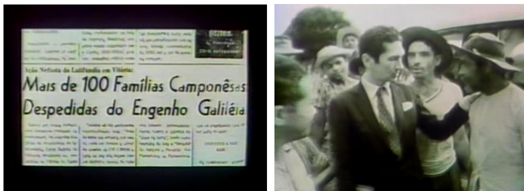
Fig.25. Os arquivos reconstróem o passado em Cabra marcado para morrer .

Ao articular o imbricamento de vários regimes de vozes, entre todos os filmes que analiso neste trabalho, o Cabra é o que expressa uma voz mais complexa. O filme é a síntese do diário de viagem de Coutinho, “do modo que fosse possível”, em busca dos personagens das filmagens de 64. Esse é um elemento que o coloca em outro patamar. Não se trata do registro da vida daquelas pessoas, mas o registro do encontro de Coutinho com elas. A realidade, portanto, não surge como um dado previamente estabelecido ou objetivamente capturada pela câmera, rompendo com a crença de que o filme captura algo imutável que ocorreria do mesmo modo sem a sua presença.