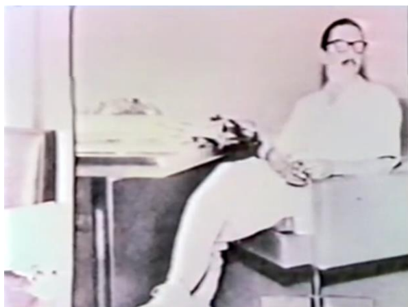
Fig.31. O farsesco em Jânio a 24 Quadros .

Nesse momento, a narração é interrompida e, ainda acompanhada da canção, vemos durante alguns segundos uma fotografia de Jânio de pernas cruzadas, vindo a adensar ainda mais o tom farsesco iniciado com as marchinhas e prosseguido pela narração inusual.